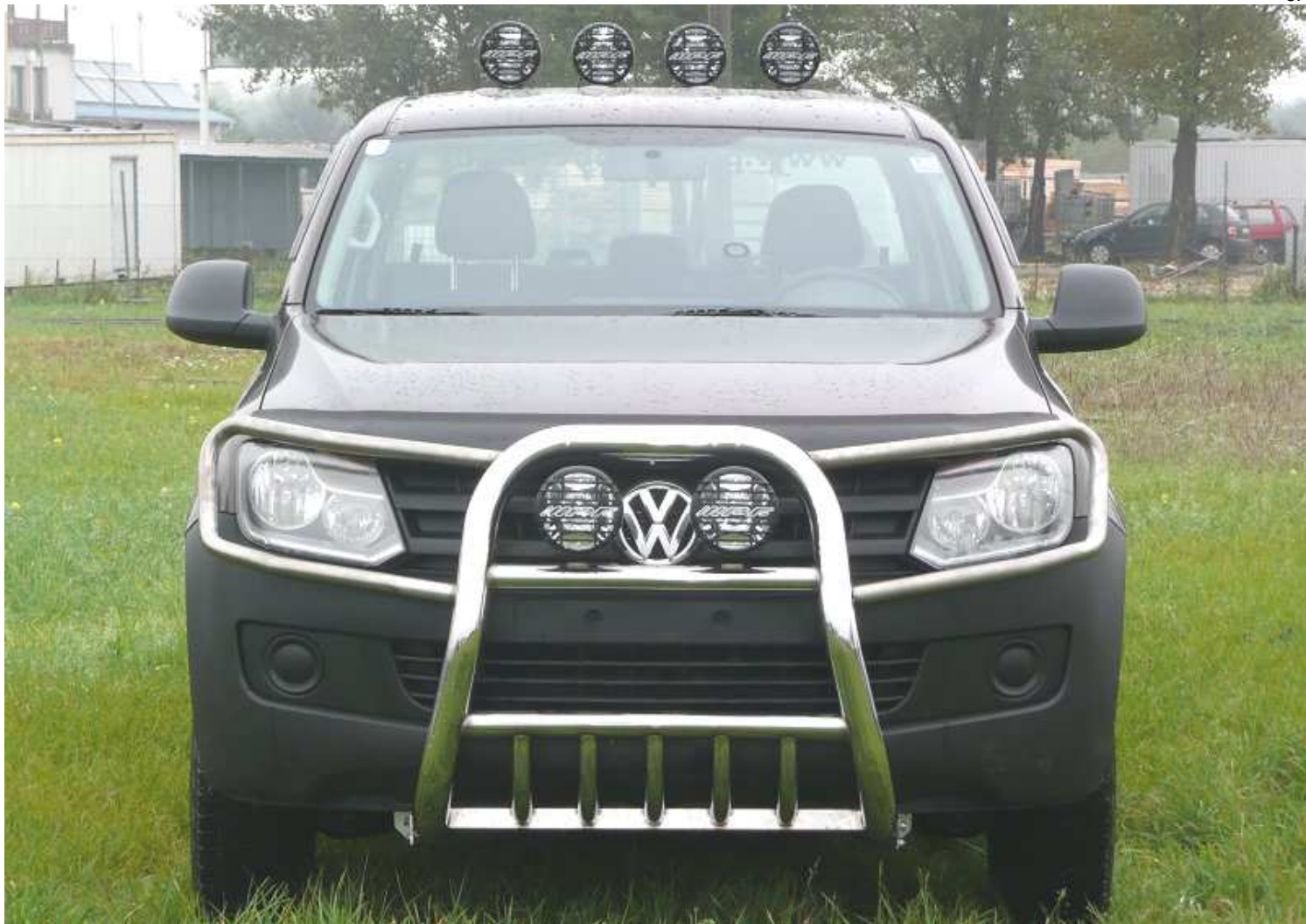
Přední rám A pr.76 s "brýlemi " na přední světla VA4 17.600,- Kč