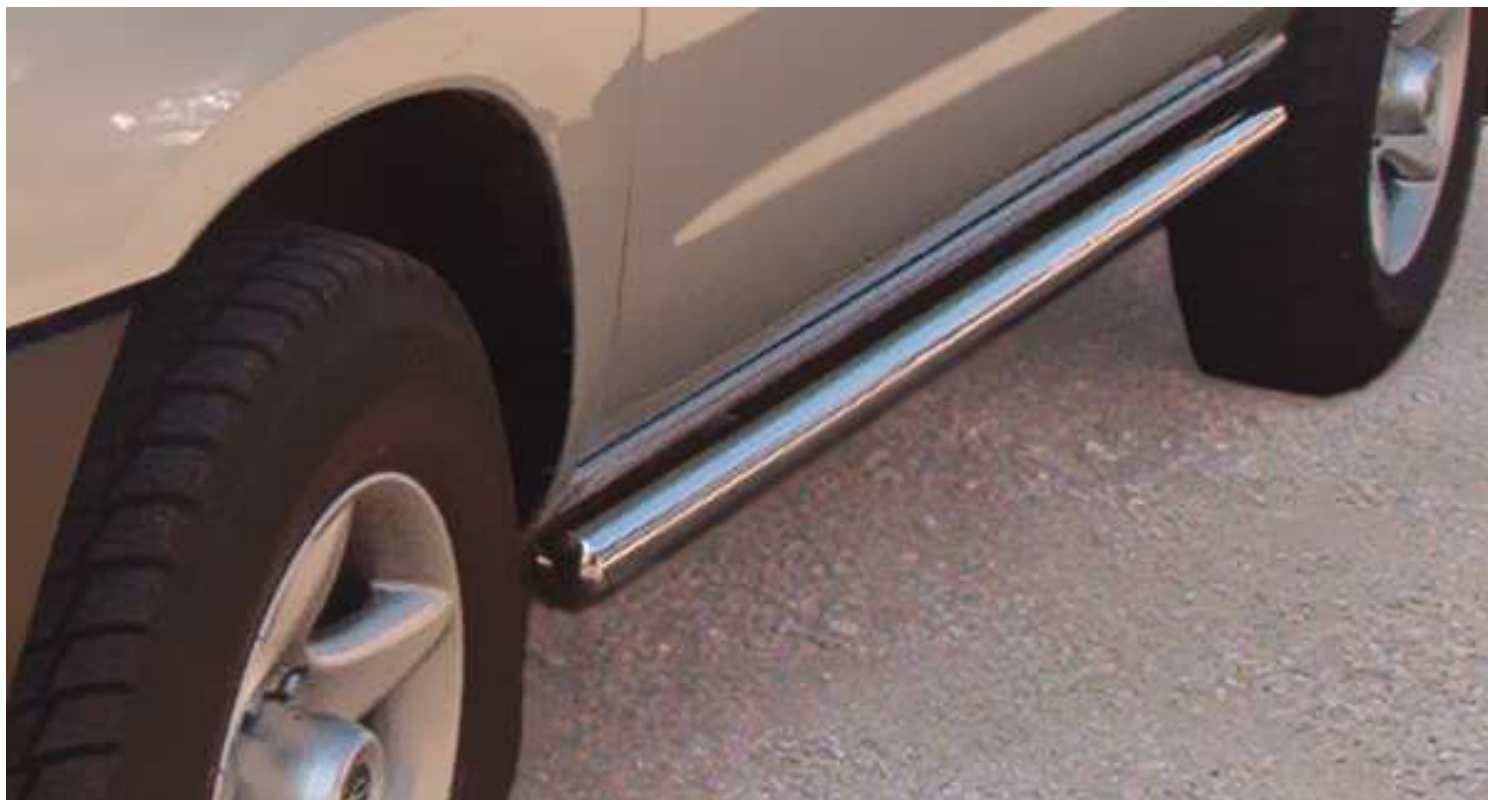
Boční nášlapy pr.76 VBN2 7.900,- Kč