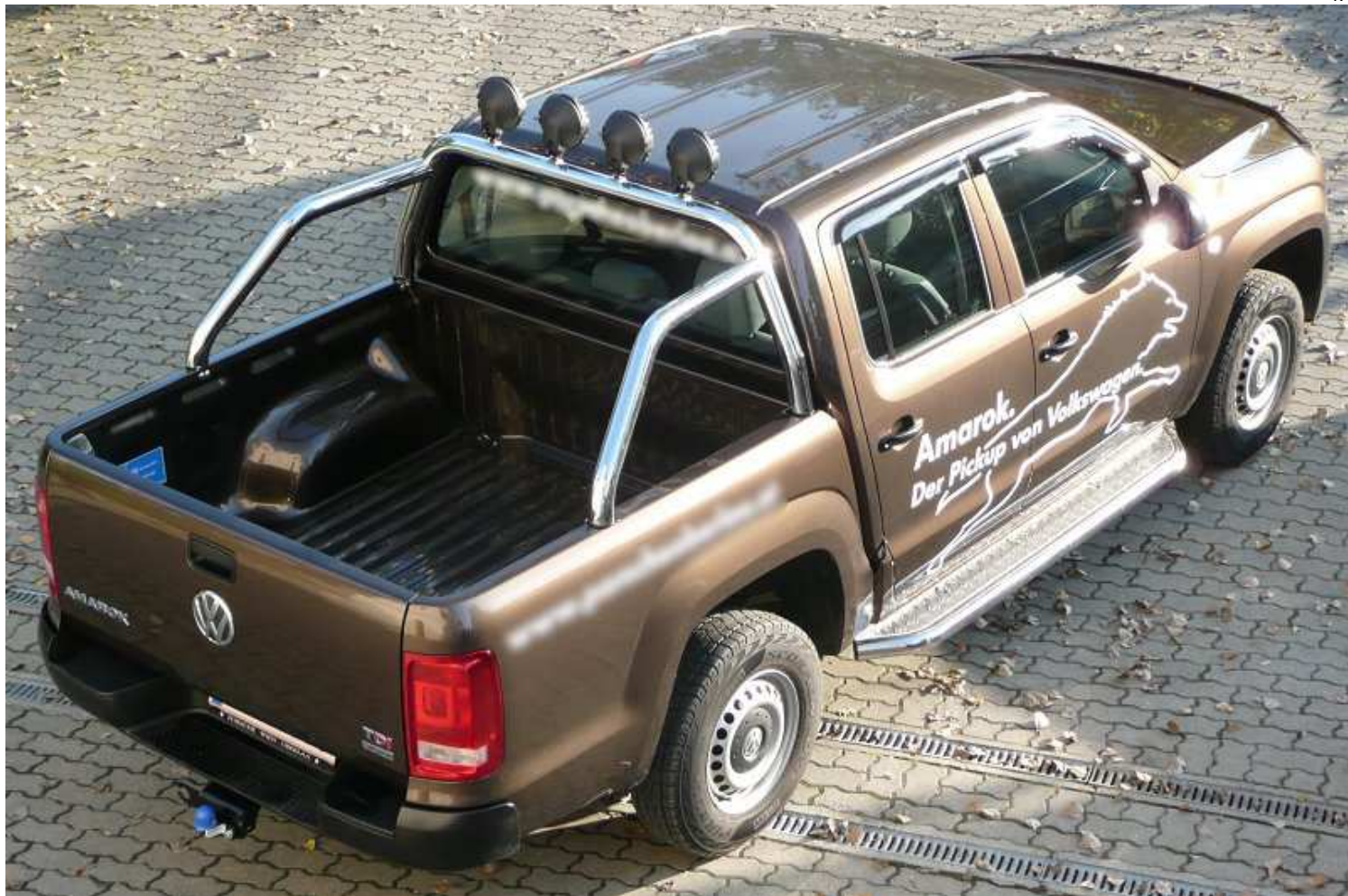
Rám korby pr.76 VRK 15.400,- Kč