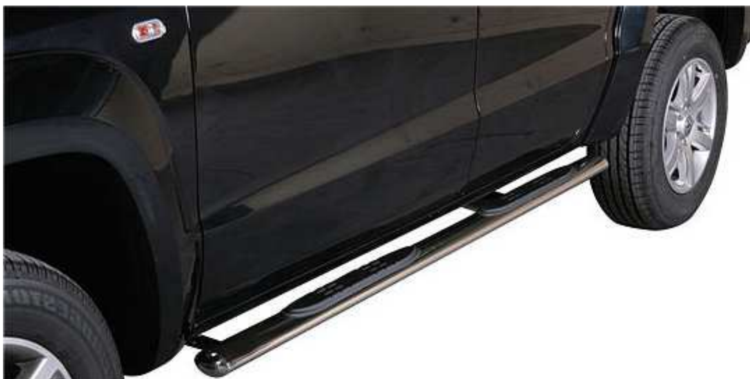
Boční nášlapy plochooválné s plastovými nášlapy VBN3 15.400,- Kč